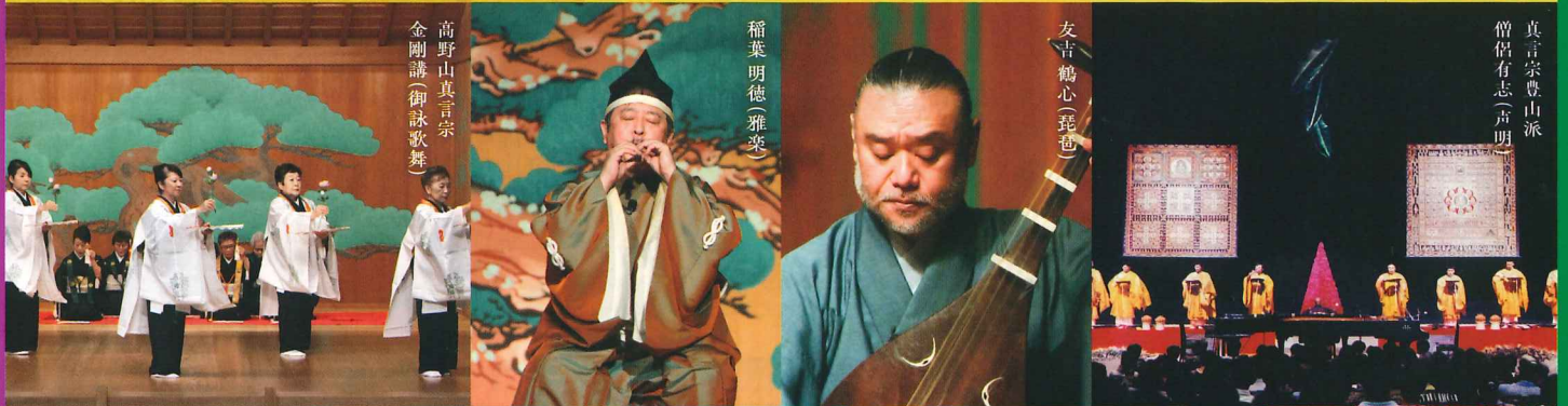
高野山真言宗 金剛講(御詠歌舞)