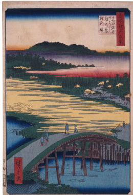
歌川広重(名所江戸百景 高田家見のはし俵の橋砂利場) (前期展示・後期は複製品を展示)