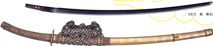
《太刀 銘 景光》