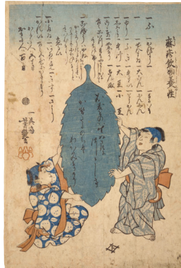
歌川芳魁(初代)《麻痺飲物業性》(後期展示)