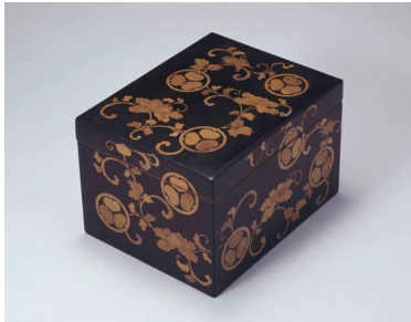
《黒塗牡丹唐草葵紋散母絵箱》