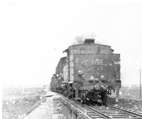
▲成岩地内(神戸川橋梁と思われる)を1150(第二次)型機関車がけん引して走る貨物列車(昭和10年ごろ)