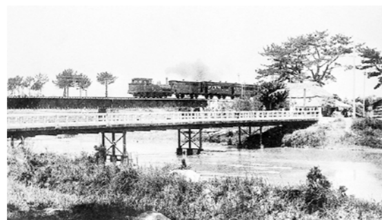
▲半田・乙川駅間の阿久比川を渡る混合列車(明治末期から大正初期)