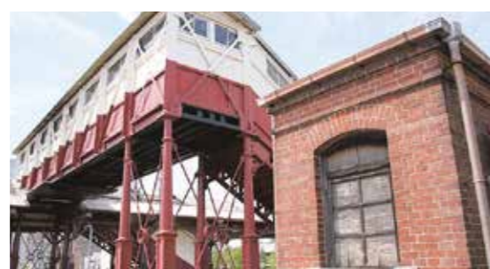
▲半田駅跨線橋と油庫