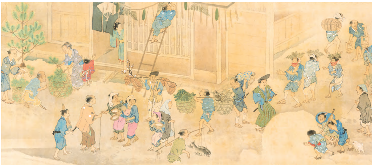
重要美術品 華洛四季遊戯図巻 二巻の内下巻 詞書 高橋宗直筆・絵 円山応挙筆 江戸時代 18世紀