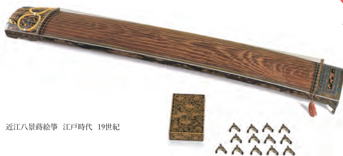
近江八景蒔絵箏 江戸時代 19世紀