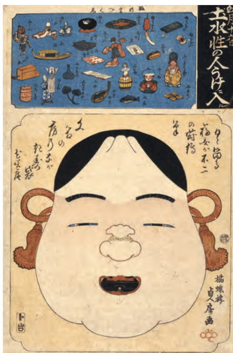
五月十六日土水性の人うけ入ル 歌川貞房画 江戸時代 弘化3年(1846)