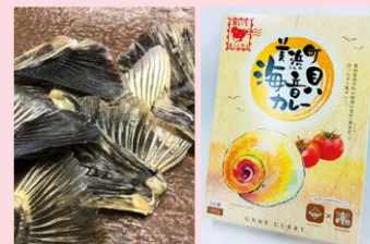
やまに旅館 ふぐひれ酒の素／海音貝カレー(レトルトカレー) 他