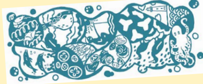
chitacotton478 ちたんぷオリジナル知多木綿手ぬぐい ※手ぬぐいの柄は見本です。