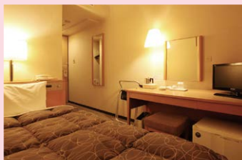
アズイン大府 シングル宿泊券 他