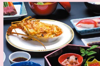
じろさん お食事券1,000円分／えびせんパーク ベッタん体験 他