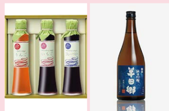
お酢の醸造蔵 三井酢店 詰め合わせギフト／國盛酒の文化館 國盛純米吟醸 半田郷酵母1801 (720ml) 他