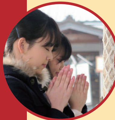
きちんとおまいり