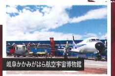
岐阜かかみがはら航空宇宙博物館