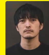
蒲郡市観光大使 漫画家・映画『音楽』『ソッキ』原作者