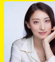
蒲郡市観光大使 女優・NHK大河ドラマ『べらぼう』出演決定!