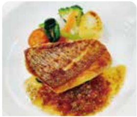
ランチC おすすめセット

今川町 tarte&cafe tatan西尾店 ☎0563-53-3401 ⑧火曜日 ①10:00~20:00