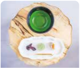
西尾伝統「濃茶セット」菓子3種盛り

坂町 鈴為商店 ☎0563-54-4050 ⑧火曜日、第1月曜日 ①9:00~18:00