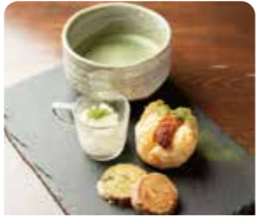
西尾のスイーツプレート

今川町 COFFEESTAND MANCHAN ☎050-3145-0073 ⑧水曜日 ①10:00~19:00