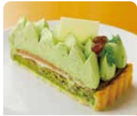
西尾グリーンティのタルト

永吉 こめ蔵パトス ☎0563-54-1777 ⑧日曜日 ①9:30~19:00