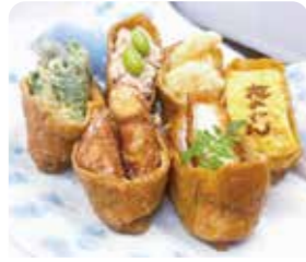
彩りいなり(白米飯)6個

下町 西尾温泉 茶の湯 ☎0563-64-0026 ⑧不定休 ①11:00~22:30(LO22:00)