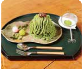
松鶴園の抹茶モンブラン極み

花ノ木町 フランス厨房ノエル ☎0563-54-7767 ⑧月曜日 ①11:30~15:00、18:00~22:00