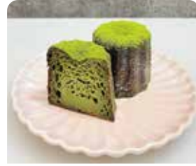
隠れ家カヌレ 西尾抹茶

下道目記町 nuuuuma ☎080-3680-9914 ⑧火・水・木曜日 ①12:00~18:00