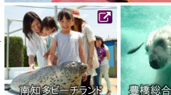
南知多ビーチランド