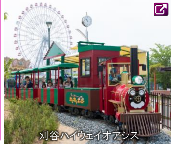
刈谷ハイウェイオアシス