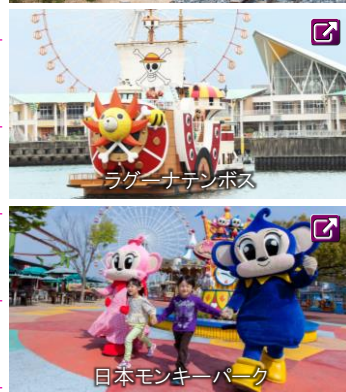
ラグーナテンボス