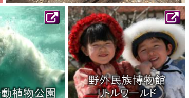
野外民族博物館 リトルワールド

記号: ■■■ JR・私鉄 ■■■ バス・タクシー ■■■ 船舶 ■■■ 徒歩 ■■■ URLリンク