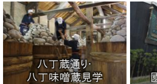
八丁蔵通り 八丁味噌蔵見学

犬山温泉(犬山市) 木曽川のほとりに湧出する温泉。「白帯の湯」と呼ばれ、木曽川沿いに建つ5つの宿で楽しむことができます。