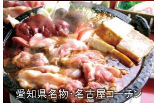
愛知県名物 名古屋コーチン