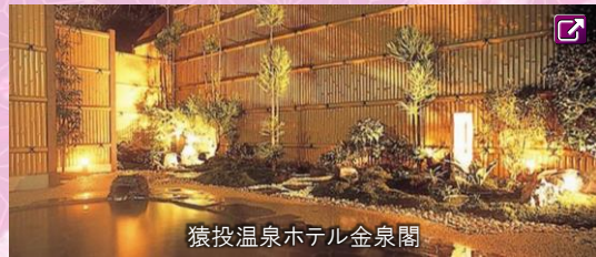
猿投温泉ホテル金泉閣