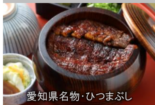
愛知県名物 ひつまぶし