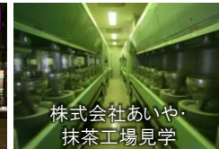
株式会社あいや 抹茶工場見学

記号: ■■■ JR・私鉄 ■■■ バス・タクシー ■■■ 船舶 ■■■ 徒歩 ■■■ URLリンク