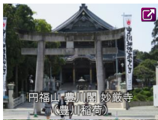
豊川稲荷 妙厳寺 (豊川稲荷)