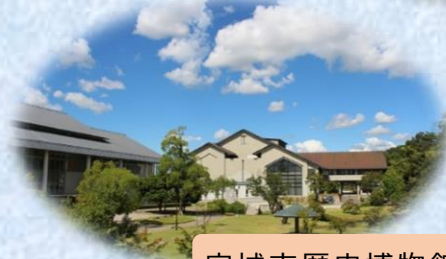
安城市歴史博物館