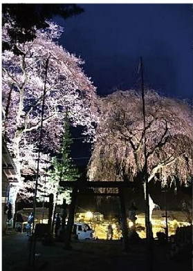
(上黒川地区 熊野神社)