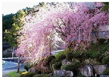
(道の駅グリーンポート宮嶋 周辺)