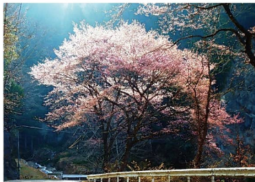
みどり湖畔の桜の開花状況は「ダム好きおばさんの今日のみどり湖」 http://damusukobasan2.hamazo.tv/