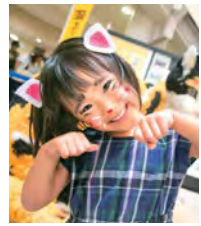
来る福招き猫まつり