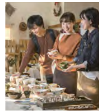
ゆるり秋の窯めぐり