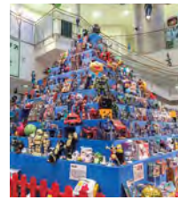
瀬戸蔵ロボット博 (3年に一度開催)