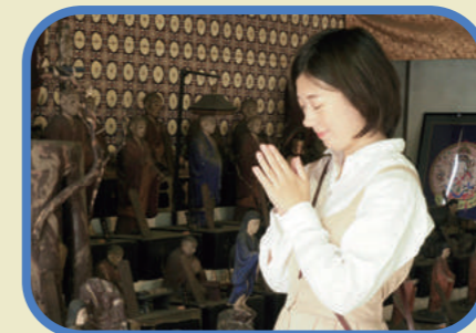
きちんとおまいり