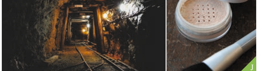
J Pengalaman menambang + Pengalaman membuat kosmetik "naori" (Kota Toei)

Pantai Teluk Mikawa dan Semenanjung Chita diberkati dengan iklim sedang, sehingga Anda dapat menikmati berburu buah yang berbeda di empat musimnya.