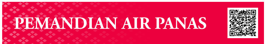
L Minamichita Hot Spring Resort (Kota Minamichita)

Kota Toei adalah daerah penghasil serisit (mika putih berbutir halus) yang merupakan bahan dasar kosmetik. Anda dapat mempelajari bahan dasar kosmetik, dan mencoba pengalaman khusus membuat kosmetik sendiri.