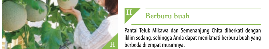
H Berburu buah

Tanjung yang indah di ujung Semenanjung Atsumi dikenal sebagai tempat suci para kekasih.