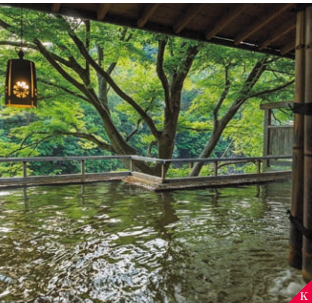
K Yuya Hot Spring (Kota Shinshiro)

Sakushima, pulau dengan karya seni dan rumah berdinding hitam yang selaras dengan keindahan alamnya. Membuat seluruh pulau terlihat bagaikan museum seni.