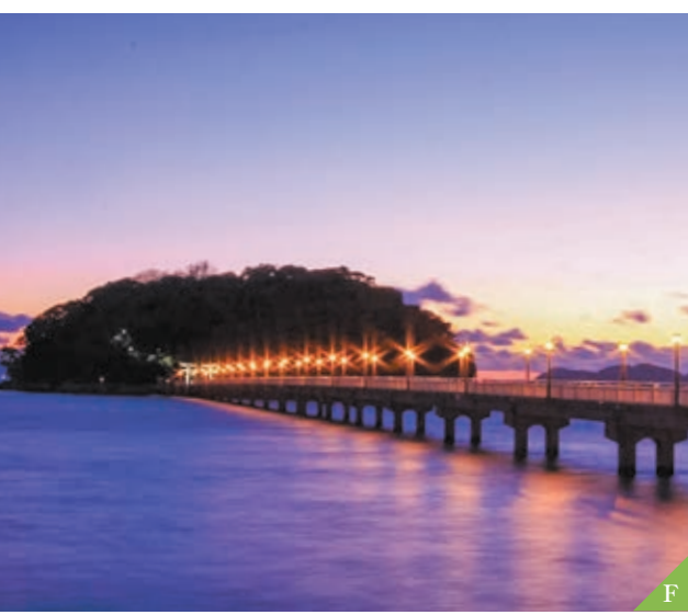
F Pulau Takeshima (Kota Gamagori)

Ada banyak atraksi untuk dilihat, kuil-kuil yang terkenal untuk mencari berkah keberuntungan, persalinan yang aman, serta jodoh pernikahan, juga akuarium dan pemandangan alam yang indah.