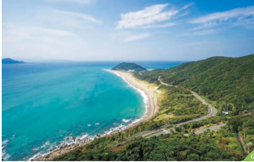
G Irago Misaki - Tanjung Irago (Kota Tahara)

Kota sumber air panas dimana berderet ryokan (penginapan tradisional Jepang), di sepanjang sungai yang terkenal sebagai tempat yang indah.