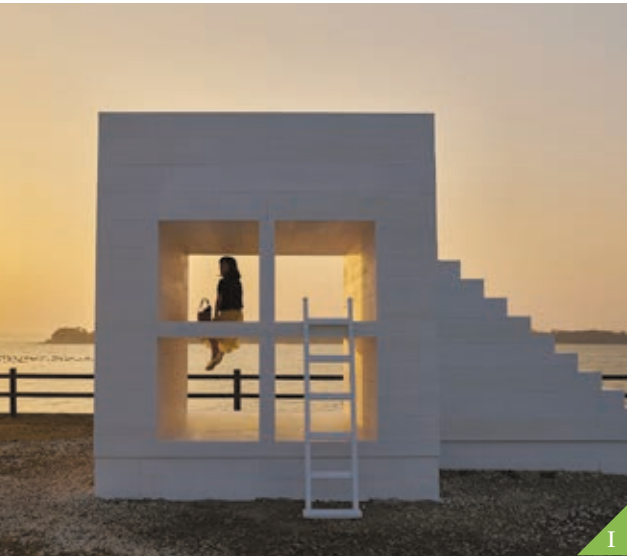
I Pulau Sakushima (Kota Nishio)

Ada banyak atraksi untuk dilihat, kuil-kuil yang terkenal untuk mencari berkah keberuntungan, persalinan yang aman, serta jodoh pernikahan, juga akuarium dan pemandangan alam yang indah.