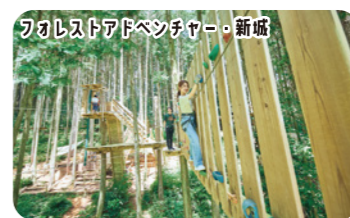
地上18mを含む7本のジップラインが体験できるコース