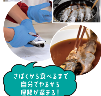
さばくから食べるまで自分でやるから理解が深まる!

お魚について学び、さばく・調理・食べるの体験から三河湾の環境や魚について学べます。室内での体験なので、荒天時も実施できます。