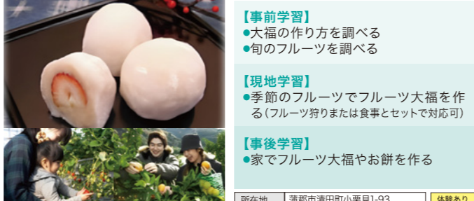
受入人数 120人 所要時間 30分

いちご、みかん、巨峰、マンゴーなど季節のフルーツで、フルーツ大福を作ります。家で簡単にできるお餅のつくり方の解説もあります。