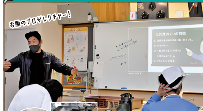
お魚のプロがレクチャー!