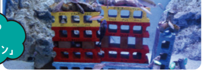
魚のマンションのよう な「カサゴマンション」