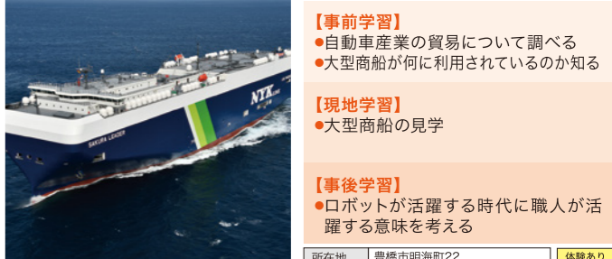
受入人数 2~200人/日 所要時間 90~120分

鉄板から全長200m級の大型商船に変わっていく様子を学びます。船や重機のスケールの大きさを感じながら、貿易大国日本を支える船の秘密に迫ります。