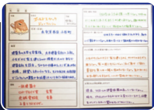
飼育員のお魚愛に溢れる書きの解説は大人気!