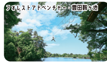
恐怖心に打ち勝て! スリルと爽快感満点の池越えジップライン