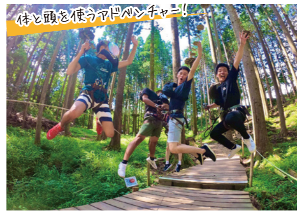
体と頭を使うアドベンチャー!

原生林を活用した自然共生型アウトドアパーク。樹上アスレチックやジップライン体験を通し、日常では味わえないドキドキ感や達成感を得ることができます。自分の安全は自分で守る危機管理能力、リーダーシップやチームワークを育みます。