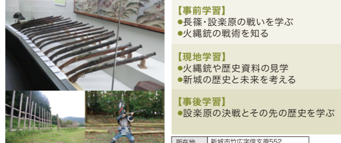
受入人数 制限なし 所要時間 60分

織田信長が考案した火縄銃の戦術をいまに伝える歴史資料館。合戦の決め手となった火縄銃を質、量ともに日本の規模で展示しています。