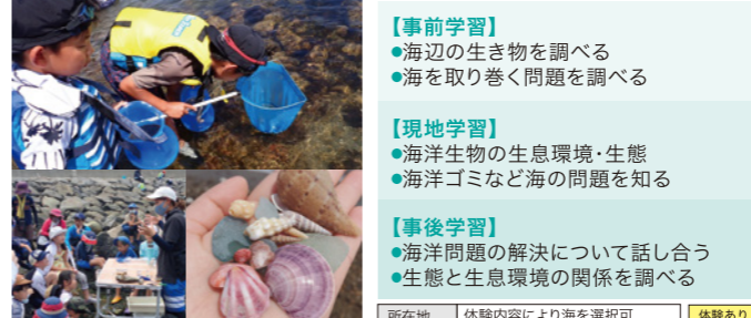
受入人数 10~40人 所要時間 90~120分

海の生き物の魅力、探索する面白さ、海と生き物の現状を深く学べる体験プログラムが揃います。身近な問題から世界規模の課題に気づくことができます。