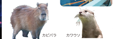
カピバラ カワウソ